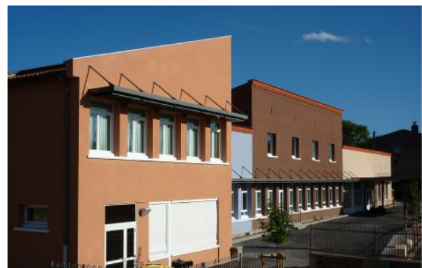
Écoles maternelle et élémentaire