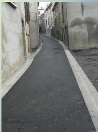
Rue de l'Enfer